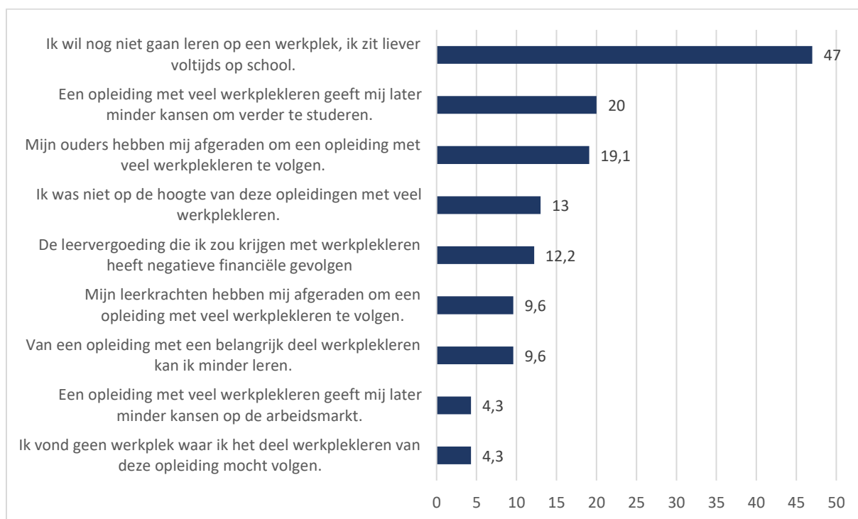
Figuur 1: Negatieve studiekeuzemotivatie t.a.v. Duaal Leren onder voltijdse leerlingen

We polsten de leerlingen naar hun studiekeuzemotivatie en meer specifiek naar de redenen om niet of juist wel voor een duale opleiding of een opleiding met een belangrijk aandeel werkplekleren te kiezen. De manier waarop we deze negatieve en positieve studiekeuzemotieven konden meten is vanzelfsprekend verschillend naargelang de verschillende doelgroepen. De leerlingen in de niet-duale spiegelopleidingen binnen scholen met – naast de duale proeftuin – een aanbod binnen het voltijds secundair onderwijs werden gevraagd om aan te duiden welke redenen al dan niet een rol speelden in hun negatieve studiekeuze ten aanzien van de duale optie. Leerlingen konden hier meerdere redenen aanduiden (zie figuur 1).