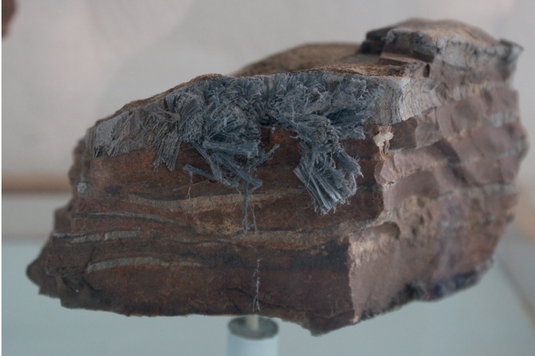
Asbestmineraal uit het asbestmuseum in Rotterdam. Let op de blauwe vezels die aan het mineraal vasthangen

van de geschiedenis van de asbestproductie en -verwerking om de houding ten aanzien van asbest in het verleden en heden in kaart te brengen.