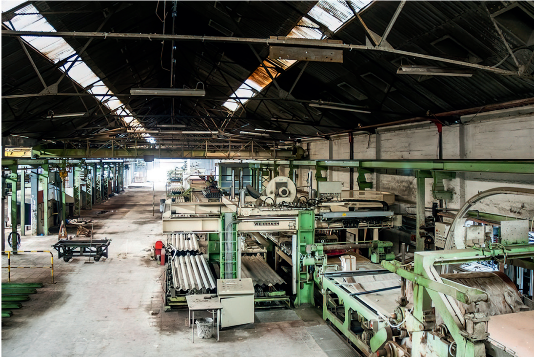
België asbestkampioen. Er zijn weinig beelden van asbestfabrieken in België. Deze foto van het voormalige J.M. Balmatt in Mol biedt een unieke inkijk in het productieproces

een daarvoor speciaal ontworpen vitrine. 12 Maar vaker worden asbesthoudende erfgoedobjecten ofwel niet herkend, ofwel in een dubbele luchtdichte verpakking in quarantaine geplaatst. In 2020 ging ETWIE (Expertisecel voor Technisch, Wetenschappelijk en Industrieel Erfgoed) van start met het project Gevaarlijk Erfgoed: naar een asbestvrije cultureel-erfgoedsector in Brussel en Vlaanderen . Dit project was gericht op de identificatie van asbestvezels en de creatie van bewustzijn omtrent de gezondheid- en veiligheidsrisico's. Dit was een eerste en noodzakelijke stap om de asbestproblematiek onder handen te nemen. Op de website ziterasbestin.be kan nu een database met asbesthoudende objecten worden geraadpleegd, zodat erfgoedprofessionals beter in staat zijn om potentieel gevaarlijke objecten te identificeren. Het betreft voornamelijk objecten uit de negentiende en twintigste eeuw, omdat asbest vooral sinds het industriële tijdperk op grote schaal in allerlei toepassingen werd verwerkt.