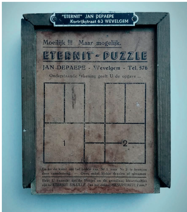
De marketing van sommige bedrijven ging soms ver. Deze asbestpuzzel is daar een mooi voorbeeld van

die verzamelingen en collecties beheren en vrijwilligers die actief het rollend erfgoed, zoals trams en bussen, borgen. In vele gevallen werkten deze mensen zelf met asbesthoudend materiaal of technische apparatuur, in een periode waar de gevaren van asbest nog niet of nauwelijks bekend waren. Deze groep heeft doorgaans een sterke emotionele band met de objecten, en neemt een positieve houding aan ten aanzien van het erfgoed, gezien ze zich actief inzetten om het te beschermen. Verder zijn er ook actiegroepen die een juridische strijd voeren tegen asbestverwerkende bedrijven, zoals o.a. de Vereniging van Asbestslachtoffers in België. 35