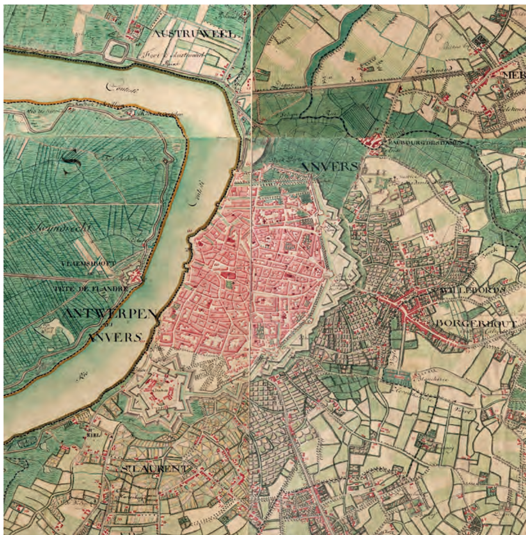
Antwerpen in de late achttiende eeuw