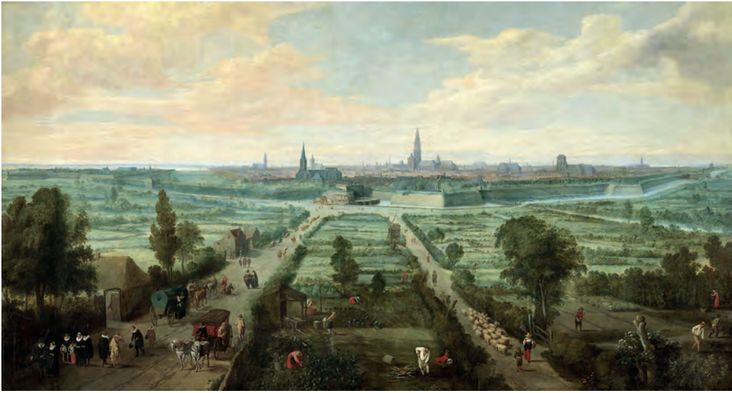
Jan Wildens, Zicht op Antwerpen, 1656