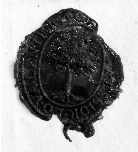
Zegel van de lutherse gemeente van Antwerpen bij een brief van 19 april 1617. Rondom de boom staat het (niet meer volledig leesbare) opschrift "A.C.A. Quo pressior eo valentior": Antwerpse kerk van de Augsburgse Confessie, sterker door vervolging. [GAA, Archieven kerkenraad en ouderlingen Evangelisch-Lutherse gemeente, 127]

de dienende predikant zo lang mogelijk onbekend bleef.