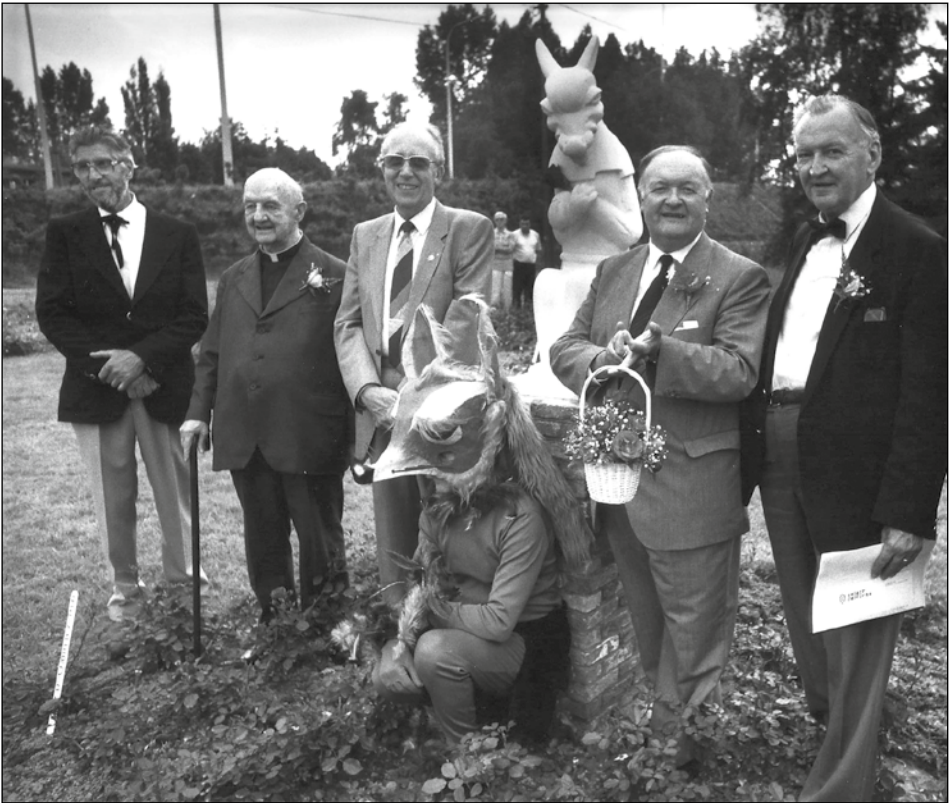
Afb. 2, foto © Paul de Malsche

Jaar na jaar werd de tuin een reynaertiaanse roos en een Reynaertbeeld rijker. Op 7 augustus 1990 werd Tiecelijn de raaf met in de bek een gele Tie-