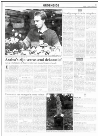
Afb. 4

Verwees '(a)' naar een/de 'anonieme fotograaf'? Even later vond ik niet alleen de foto, maar ook de volledige pagina van een tweede exemplaar van dezelfde krant, helaas niet gedateerd. Ik maakte snel een lijstje van de lokale persfotografen 20 uit het begin van de jaren negentig, tijden waarin elke krant nog eigen fotografen had (dit terwijl de lokale pers vandaag nog bestaat uit twee krantenredacties waar de journalist tevens de fotograaf van dienst is). De