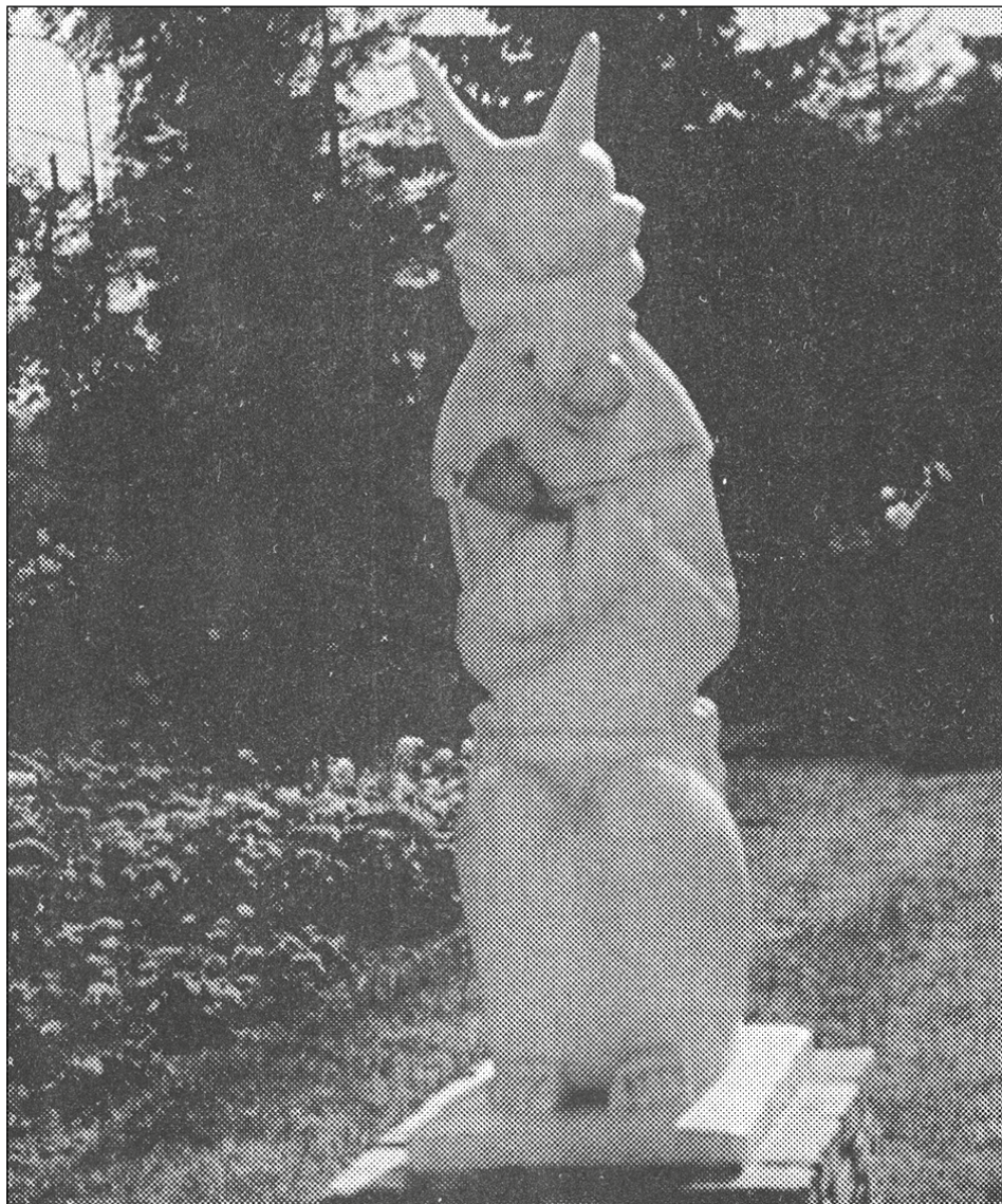
Afb. 6