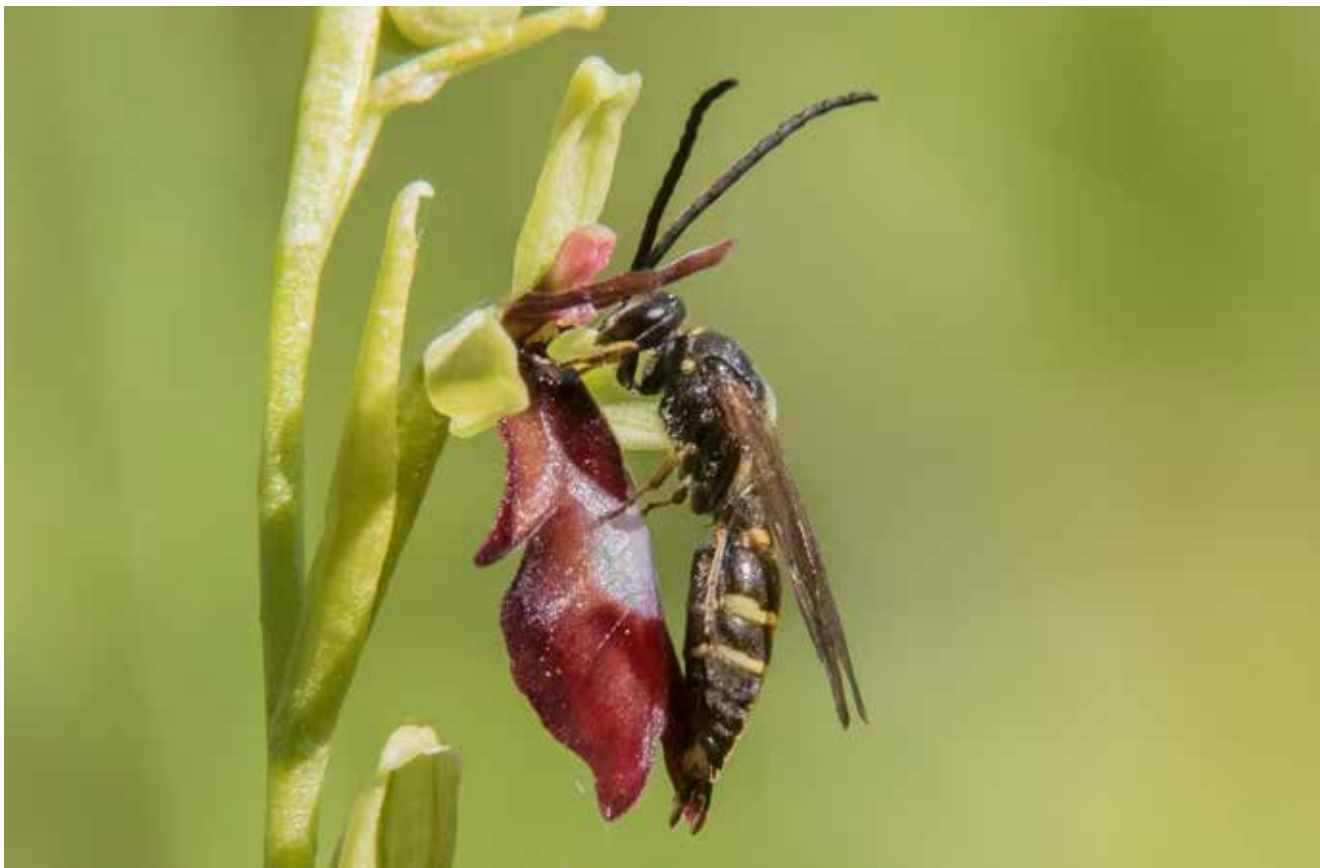
Figuur 3. Mannelijk exemplaar van Argogorytes mystaceus (Hym. Crabronidae) dat probeert te paren met een bloem van de Vliegenorchis Ophrys insectifera.