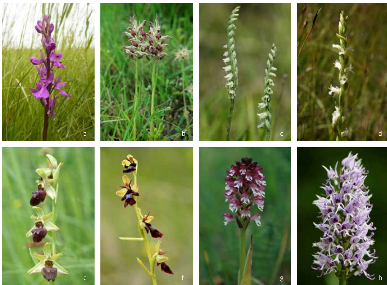
Figuur 2. Overzicht van in Vlaanderen uitgestorven orchideesoorten. a) Moerasorchis Anacamptis palustris , b) Wantsenororchis Anacamptis coriophora , c) Herfstschroeforchis Spiranthes spiralis , d) Zomerschroeforchis Spiranthes aestivalis , e) Spinnenorchis Ophrys sphegodes , f) Vliegenorchis Ophrys insectifera , g) Aangebrande orchis Neotinea ustulata , h) Aapjesorchis Orchis simia .

verschillende soorten per uurhok gevonden worden. Los van een aantal lokale uitzonderingen zoals het Torfbroek in Kampenhout en de Mene- en Jordaanvallei in Hoegaarden, is de rest van Vlaanderen eerder soortenarm te noemen (Figuur 1).