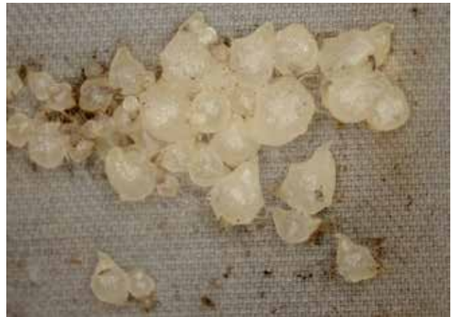
Figuur 4. Gekiemde zaden (protocormen) van Groenknolorchis Liparis loeselii in zaadpakketjes. (© Rein Brys & Hans Jacquemyn)

De lage vruchtzetting van orchideeën wordt gecompenseerd door de productie van een groot aantal zaden (van enkele honderden tot een miljoen zaden per vruchtdoos). De zaden zijn echter zeer klein en bevatten weinig of geen nutriënten, waardoor ze voor kieming volledig afhankelijk zijn van mycorrhizale schimmels (Rasmussen & Rasmussen 2009). Deze schimmels kunnen overleven onafhankelijk van de orchidee, maar recente studies hebben aangetoond dat de abundantie van schimmels doorgaans het hoogst is in de onmiddellijke nabijheid van gevestigde planten (Waud et al. 2016a). Dat impliceert dat zaden een grotere kans op kieming zullen hebben in de onmiddellijke nabijheid van gevestigde planten. Ondanks het feit dat de meeste schimmels wijdverspreid blijken voor te komen in de natuur (Jacquemyn et al. 2011, Davis et al. 2015), is hun voorkomen in de bodem niet regelmatig en vertonen ze vaak een geclusterd patroon (McCormick et al. 2016, Waud et al. 2016b). Het spreekt