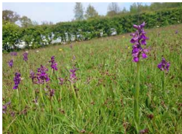
Figuur 7. Harlekijn Anacamptis morio , een orchideesoort die gebaat kan zijn bij een doordacht herintroductieprogramma. De foto geeft het voorkomen van Harlekijn weer na introductie in een semi-natuurlijke tuin in Tielt-Winge.

In het Verenigd Koninkrijk werd gestart met een grootschalig herstel- en herintroductieprogramma van Vrouwenschoentje Cypripedium calceolus (Figuur 6). Hiervoor werd enerzijds ingezet op het herstel en uitbereiding van de betreffende habitat van deze soort, en werd anderzijds een grootschalig opkweekprogramma uitgewerkt. In 1930 kwam de soort nog slechts in één populatie voor, waar ze herontdekt werd nadat eerder verondersteld was dat ze was uitgestorven in 1917. De spectaculaire achteruitgang van de soort was voornamelijk het gevolg van intensief verzamelen door amateurbotanisten voor tuinen en botanische collecties. Vanaf de jaren '70 werd de laatste groeiplaats van de soort intensief beheerd, met succes. De laatste, overblijvende kloon nam toe in grootte en ook het aantal bloemen nam gestaag toe. English Nature en The Sainsbury Orchid Conservation Project, genoemd naar Sir Robert Sainsbury,