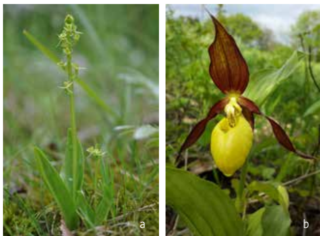
Figuur 6. Voorbeelden van twee orchideesoorten (links: Groenknolorchis Liparis loeselii , rechts: Vrouwenschoentje Cypripedium calceolus ) waarvoor in de ons omringende landen een herintroductie-programma werd uitgewerkt en succesvol geïmplementeerd.

2006 gestart met een herintroductieprogramma van een 12-tal sterk bedreigde orchideesoorten op 22 locaties. Hoewel sterk variabel tussen de soorten, slaagden in elk van deze gevallen geïntroduceerde planten erin om te overleven en om de jaren nadien opnieuw te verschijnen. In 82% van de populaties kwamen planten ook tot bloei en in 63% van de populaties werd ook vruchtzetting vastgesteld, wat weergeeft dat de noodzakelijke bestuivers aanwezig waren op de plaatsen waar herintroducties hadden plaatsgevonden. In 18% van de populaties werd in de volgende jaren ook kiemplantrecrutering vastgesteld, wat in een toename van de populatiegrootte resulteerde van 26 tot 75%. Wanneer dit cijfer vergeleken wordt met herintroducties in het algemeen, zijn de cijfers voor orchideeën hoopgevend (52% overleving, 19% bloei, 16% vruchtzetting, 5% recrutering van kiemplanten) (Godefroid et al. 2011, Dalrymple et al. 2012). In 80% van de Australische herintroducties werd het voorkomen van de bestuiver bevestigd voordat de herintroductie had plaatsgevonden. Belangrijk om te vermelden is dat alle herintroducties vertrokken van symbiotisch gepropageerd materiaal, dus van planten die onder optimale labo-omstandigheden kiemden met behulp van de geschikte schimmel (Reiter et al. 2016).